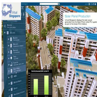
<버추얼 싱가포르 모습>