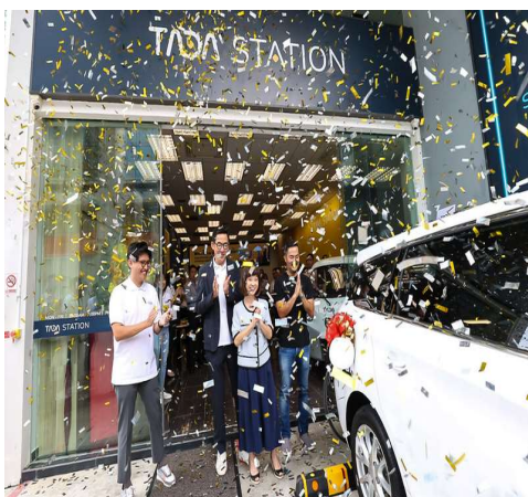
〈그림〉 타다 미디어 시티 스테이션 출범식