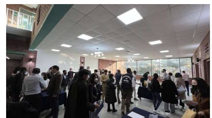
사단법인 해외건설협회 · 개도국 공무원 지식 확산 공유회 참석자 명단